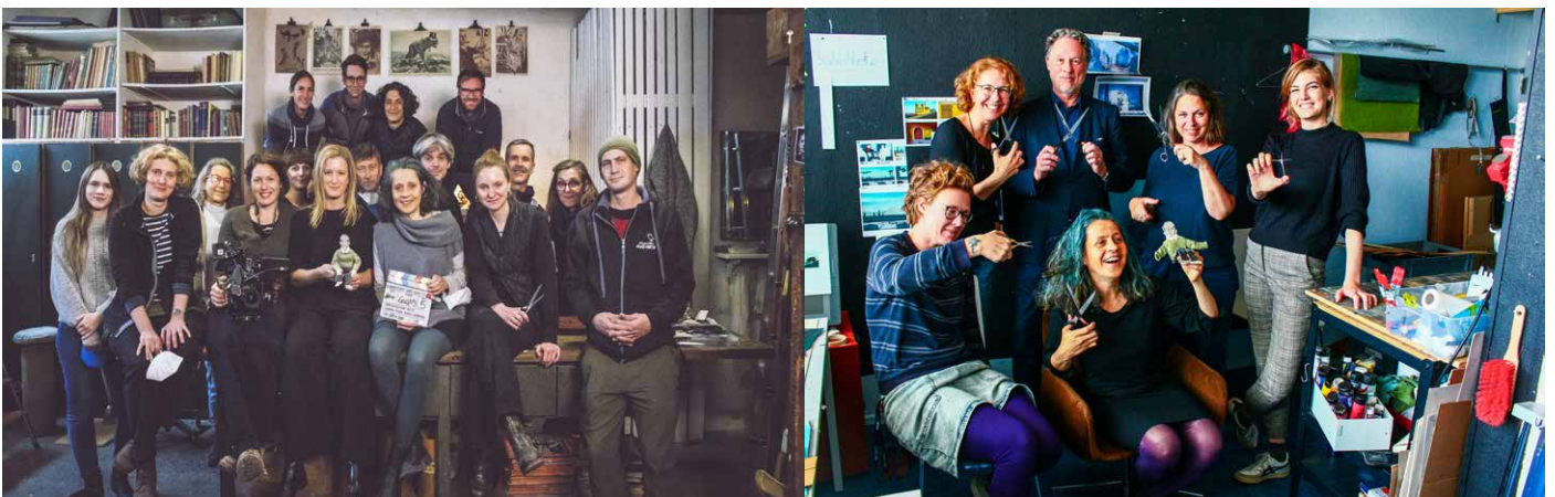
Left: team live action Vienna, right: visit Studio Cou-out-Animation Berlin

Förderungen: BKM, Medienboard Berlin Brandenburg, Filmförderungsanstalt, DFFF (D)/ Österreichisches Filminstitut, Fisa, Filmfonds Wien (A)/ BAK, Zürcher Filmstiftung, Studienbibliothek (CH) Sender: RBB, Arte, SRF