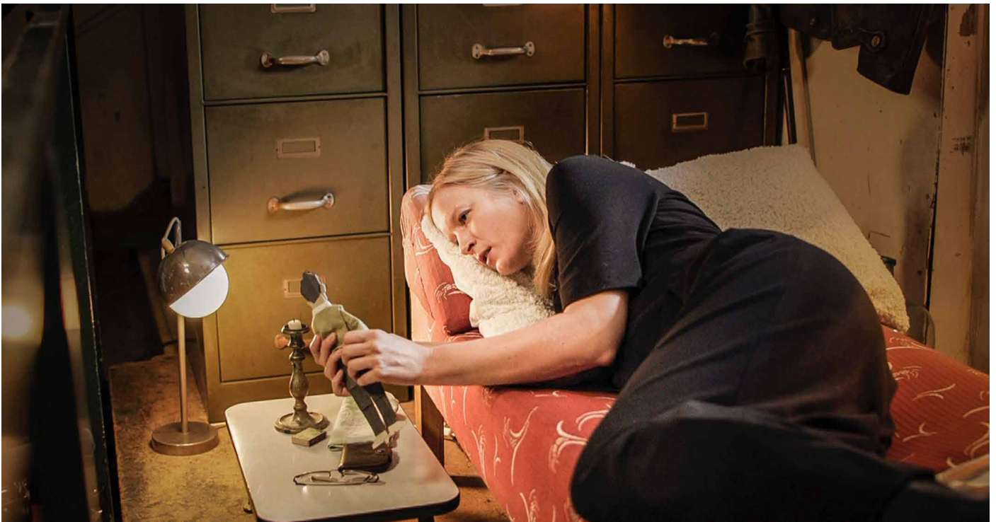
Die Realfilmszenen wurden in einem Wiener Studio gedreht.